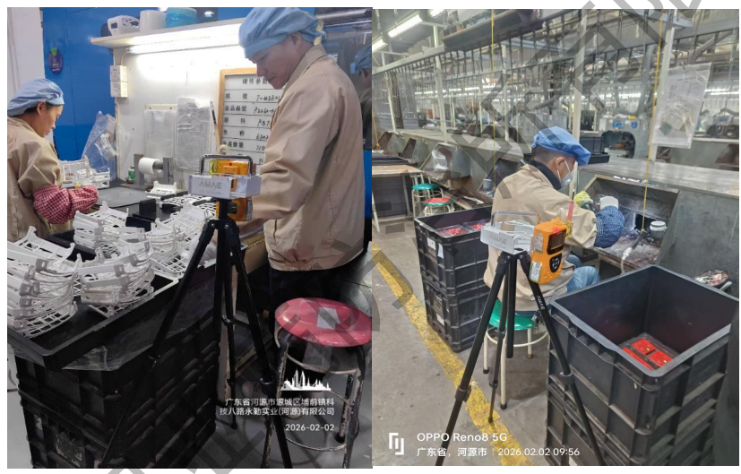
现场定点有机物采样