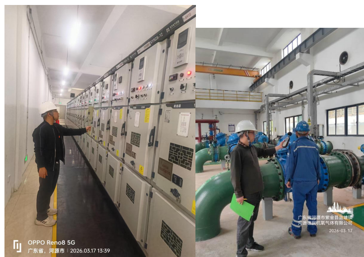
配电房工频电场测量