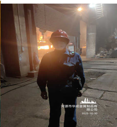
河源市华成金属制品有 限公司 2025-10-30