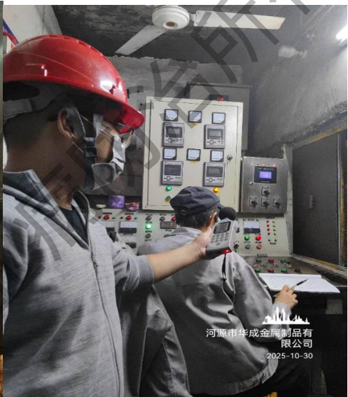
河源市华成金属制品有 限公司 2025-10-30