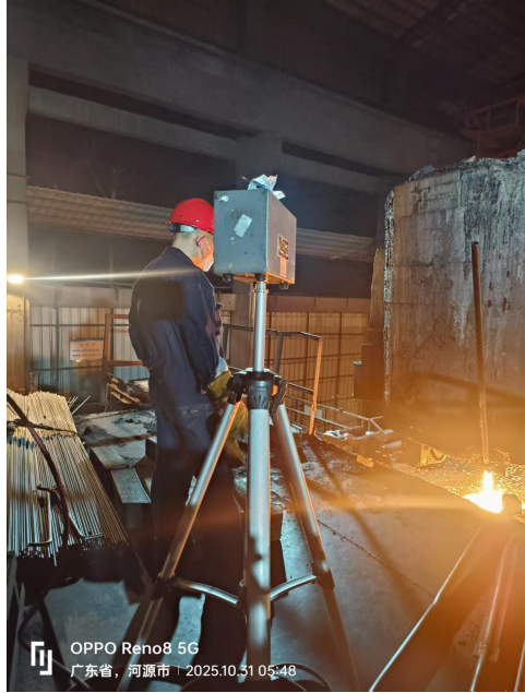
OPPO Reno8 5G 广东省, 河源市 | 2025.10.31 05:48