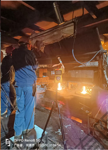
OPPO Reno8 5G 广东省, 河源市 | 2025.10.31 04:54