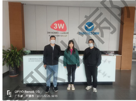
现场采样/测量显著标识合影