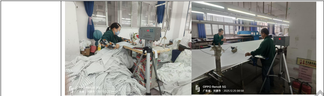
现场定点粉尘采样