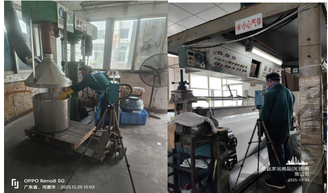
现场定点有机物采样