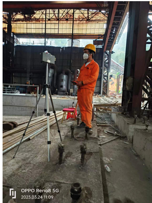
现场定点粉尘采样